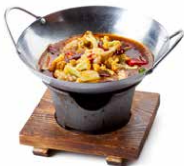
191 SCODELLA AI CALAMARI* 🌿 verdure mix e calamari*