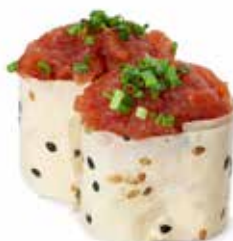
139 GUNKAN SOY SPICY TONNO 🌿 riso avvolto con sfoglie di soia, con sopra spicy tonno e cipollina