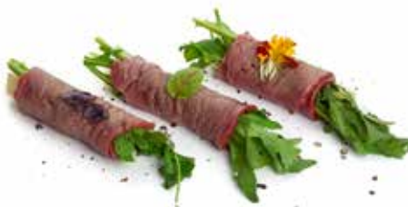
808 CARPACCIO DI MANZO* FLAMBÉ rucola e grana arrotolato con manzo* e pepe nero