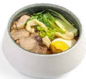
156 SPAGHETTI IN BRODO CON MANZO* manzo, uova, verdure e cipollotti