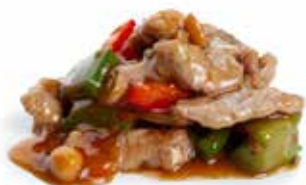
208 MANZO* PICCANTE manzo*, arachidi, peperoni, cipolla,