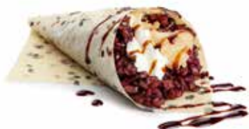
54 TEMAKI BLACK EBITEN sfoglia di soia con riso venere, gambero* fritto, philadelphia, salsa teriyaki e sesamo ... Allergeni: 1.2.6.7.11