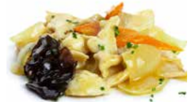
204 POLLO* AL CURRY pollo*, curry, carote, cipolla, funghi