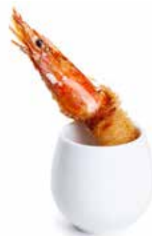
07 GAMBERO* KATAIFI gambero* fritto avvolto con kataifi