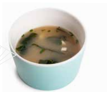
159 ZUPPA DI MISO 🌿