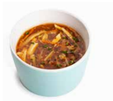
161 ZUPPA AGROPICCANTE 🌿🌿