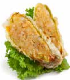
06 FIORI DI ZUCCA* fiori di zucca, surimi* di granchio*, gamberi* e carne