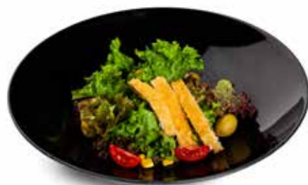
22 CHICKEN SALAD insalata mix, pollo* fritto