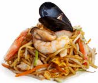
174 SPAGHETTI CON PESCE MISTO con uova, verdure mix e pesce mix ... Allergeni: 1.3.4