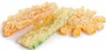
228 TEMPURA VERDURE 🌿