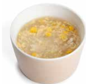
160 ZUPPA DI MAIS E POLLO* pollo*, mais, uova