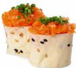
138 GUNKAN SOY SPICY SALMONE 🌿 riso avvolto con sfoglie di soia, con sopra spicy salmone e cipollina