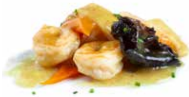
200 GAMBERI* AL CURRY gamberi*, curry, carote, bambù, funghi