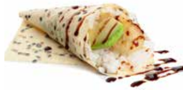
55 TEMAKI SOY EBITEN sfoglia di soia con tempura di gamberi*, avocado, salsa teriyaki e sesamo ... Allergeni: 1.2.6.11