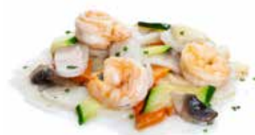
187 GNOCCHI DI RISO AI GAMBERI* gamberi*, carote, zucchine, funghi