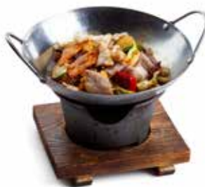
195 SCODELLA DI CARNE MISTO 🌿 manzo* e pollo*