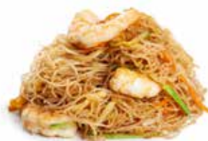
181 SPAGHETTI DI RISO CON GAMBERI* con uova, verdure mix e gamberi*