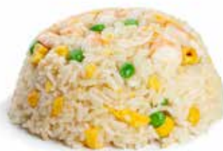
164 RISO AI GAMBERI* con uova, mais, piselli e gamberi*