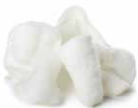
02 NUVOLE DI DRAGO*