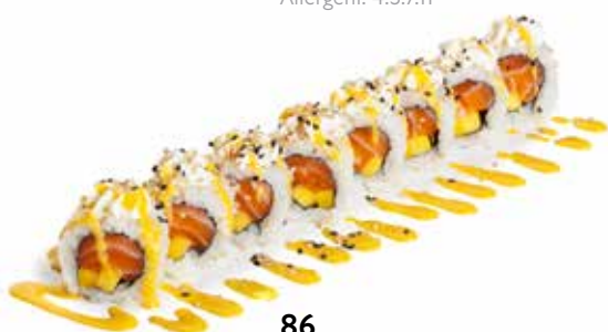
86 URA MANGO ROLL salmone, mango, philadelphia, salsa mango crema e sesamo