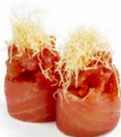
132 GUNKAN TONNO KATAIFI 🌿 riso avvolto con tonno, con sopra tartare di tonno spicy e kataifi