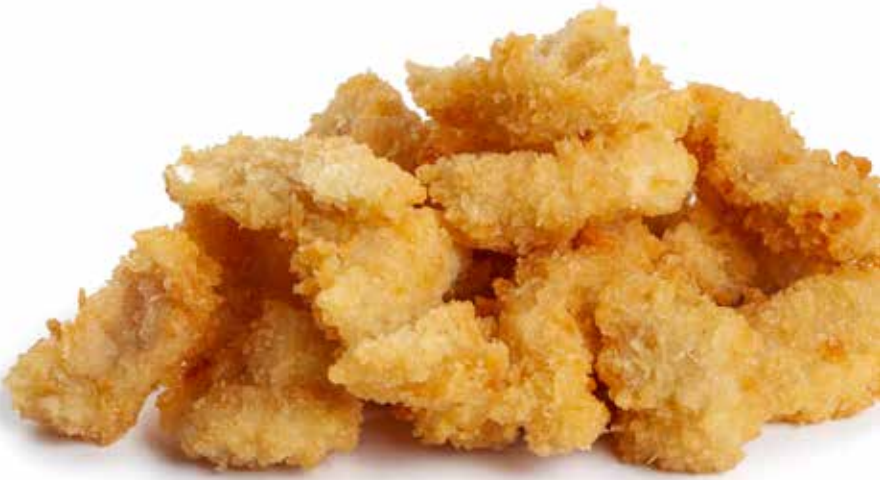
224 POLLO* FRITTO