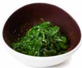
29 GOMA WAKAME* 🌿