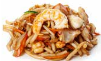
179 UDON PESCE MISTO con uova, verdure mix e pesce mix