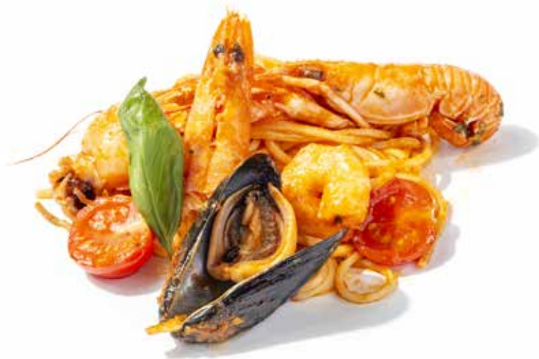
189 SPAGHETTI ALLO SCOGGIO con frutti di mare