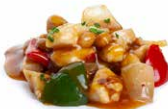
203 POLLO* PICCANTE pollo*, arachidi, peperone, cipolla,