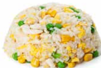
165 RISO AL POLLO* con uova, mais, piselli e pollo*