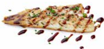
242 BRANZINO ALLA GRIGLIA con salsa teriyaki