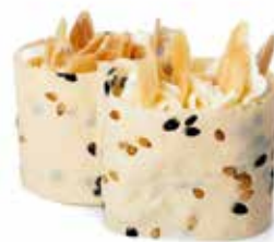
137 GUNKAN SOY MANDORLE riso avvolto con sfoglie di soia, philadelphia e mandorle