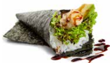
49 TEMAKI EBITEN gamberi* fritti, insalata, avocado e salsa ... Allergeni: 1.4.6