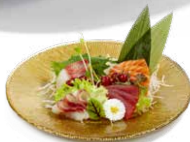
143 SASHIMI MIX salmone, tonno, branzino e ricciola