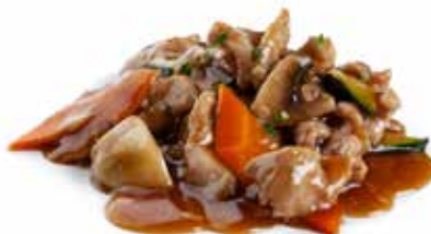
209 MANZO* CON VERDURE manzo*, carote, zucchine, funghi