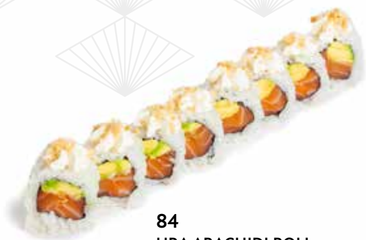
84 URA ARACHIDI ROLL salmone, avocado, philadelphia, arachidi e sesamo