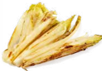
239 INDIVIA BELGA ALLA GRIGLIA 🌿