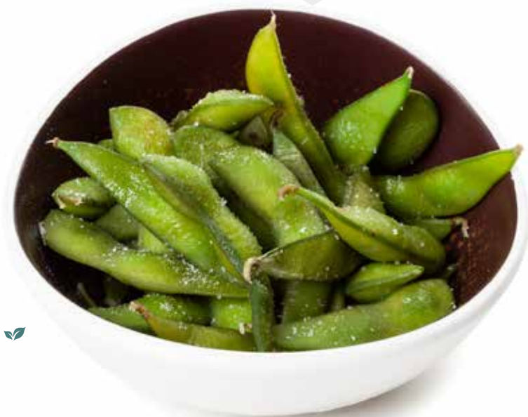
20 EDAMAME* 🌱