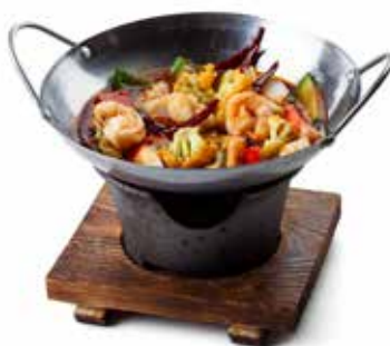
192 SCODELLA PESCE MISTO 🌿 pesce misto, cavolfiore, peperone, cipolla,