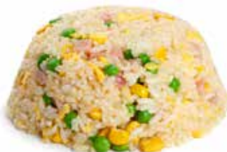
163 RISO ALLA CANTONESE con uova, mais, piselli e prosciutto