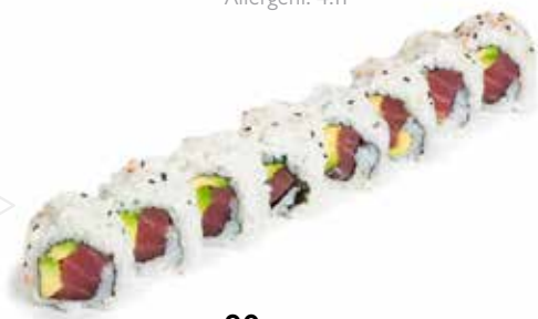
90 URA TONNO ROLL tonno crudo, avocado, sesamo