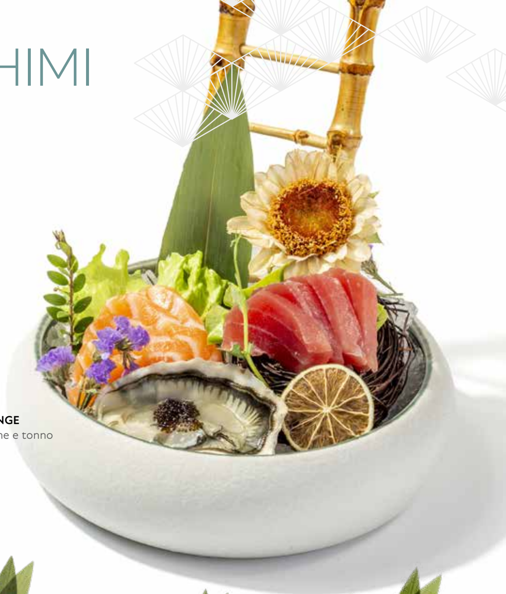
140 SASHIMI ORANGE salmone ostriche e tonno