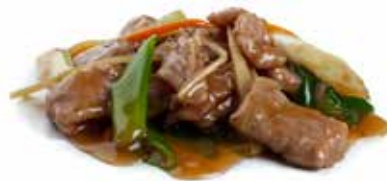
210 MANZO* CON CIPOLLA manzo* con cipolla, zenzero, porro