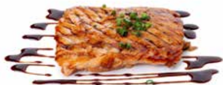
241 SALMONE ALLA GRIGLIA con salsa teriyaki