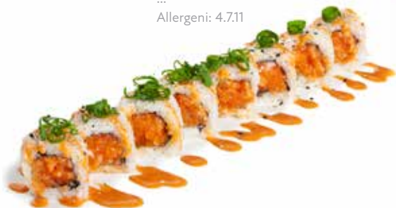
88 URA SPICY SALMONE ROLL 🌶️ tartare salmone spicy, salsa spicy, cipollotti e sesamo