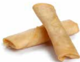
03 HARUMAKI* gamberi* e carne