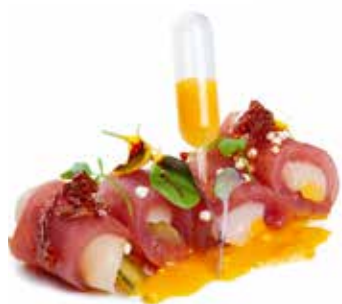
807 PASSION LOVE tonno, capesante, salsa passione