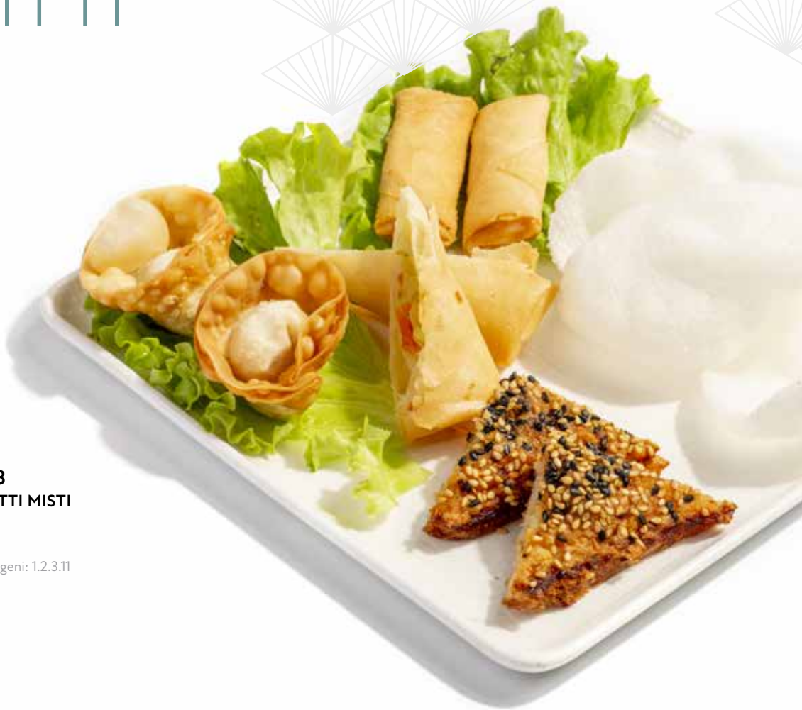
233 FRITTI MISTI