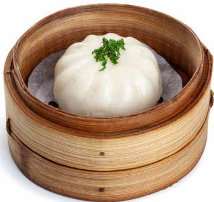
10 BAOZI* baozi bianco ripieno di carne