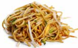
175 SPAGHETTI CON VERDURE 🌿 con uova e verdure mix ... Allergeni: 1.3