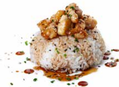
169 YAKI TORIDON riso con pollo* yaki tori e sesamo