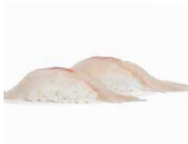
124 NIGIRI BRANZINO branzino