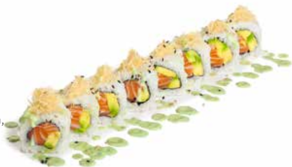
85 URA GREEN ROLL salmone, avocado, kataifi, salsa avocado e sesamo