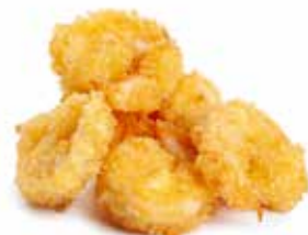
223 GAMBERO* FRITTO