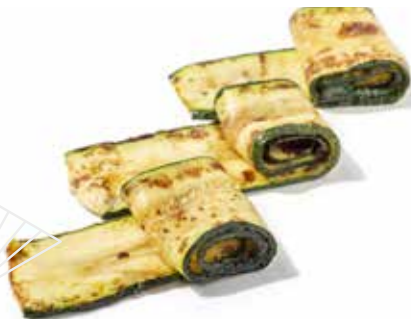
238 ZUCCHINE ALLA GRIGLIA 🌿