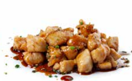
206 YAKI TORI pollo* in salsa teriyaki