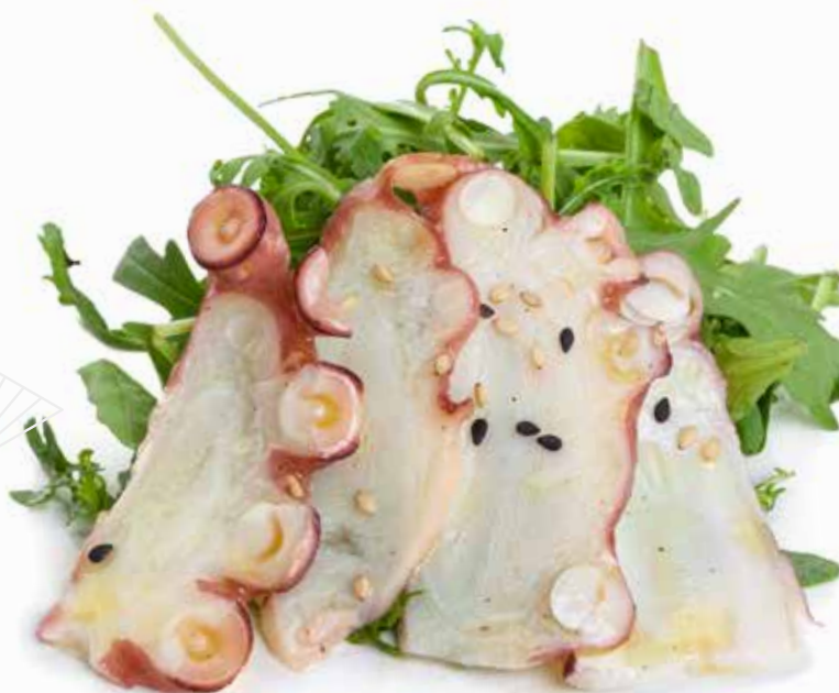
31 POLPO* RUCOLA con sesamo e salsa ponzu