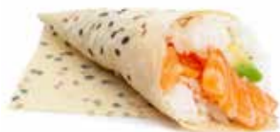
56 TEMAKI SOY SALMONE sfoglia di soia con salmone, avocado e sesamo ... Allergeni: 4.6.11