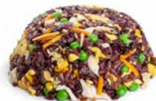
170 RISO VENERE CON POLLO* con uova, verdure mix e pollo*