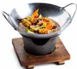
194 SCODELLA DI VERDURE 🌿🌿