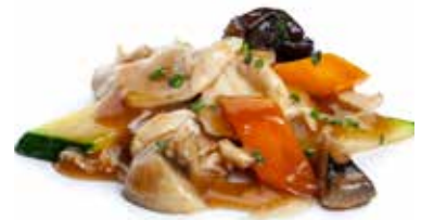
201 POLLO* CON VERDURE pollo*, zucchine, carote, funghi