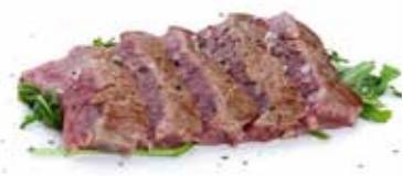
245 FIORENTINA manzo scottato con sesamo e rucola