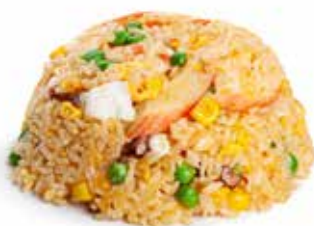
166 RISO AI FRUTTI DI MARE* con uova, mais, piselli e frutti di mare*