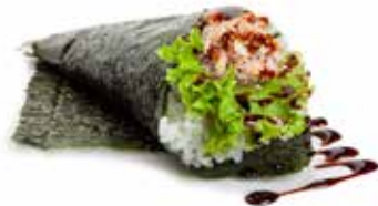
48 TEMAKI MIURA salmone cotto, insalata, philadelphia e salsa teriyaki ... Allergeni: 1.4.6.7