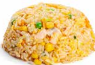
167 RISO AL SALMONE con uova, verdure mix e salmone