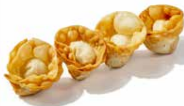
231 WANTON FRITTO carne suino e verdure