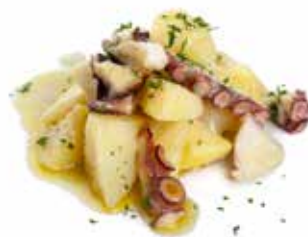
30 POLPO* PATATE