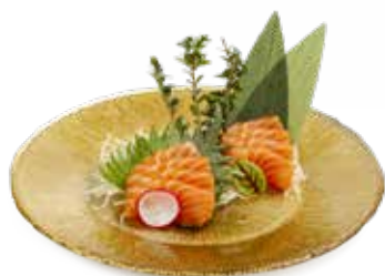
141 SALMON SASHIMI salmone