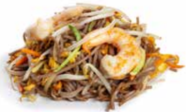
176 SPAGHETTI SOBA CON GAMBERI* con uova, verdure mix e gamberi* ... Allergeni: 1.2.3.6