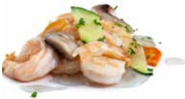
199 GAMBERI* CON VERDURE gamberi*, funghi, carote, zuccina