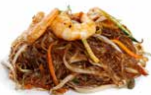
183 SPAGHETTI DI SOIA CON GAMBERI* con verdure mix e gamberi*