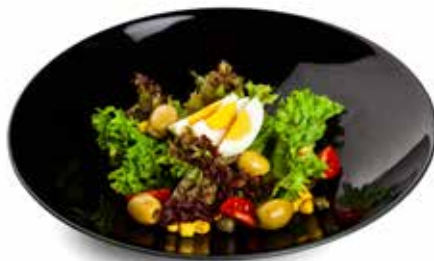
21 EGG SALAD 🌱 insalata mix, uova