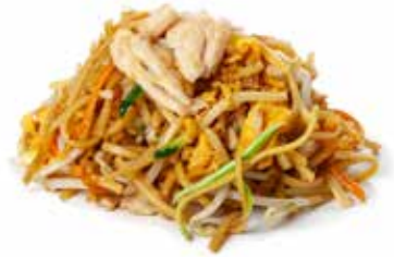
173 SPAGHETTI CON POLLO* con uova, verdure mix e pollo* ... Allergeni: 1.3