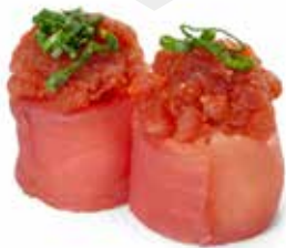
131 GUNKAN SPICY TONNO 🌿 riso avvolto con tonno, con sopra spicy tonno e cipollina