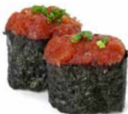
135 GUNKAN NORI SPICY TONNO 🌿 riso avvolto con alga, con sopra spicy tonno e cipollina