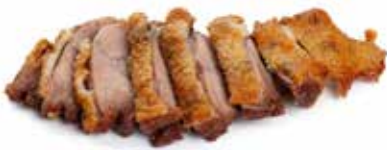
225 ANATRA FRITTA purè di patate fritto