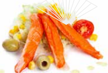
26 SURIMI* SALAD insalata mix, surimi* di granchio*