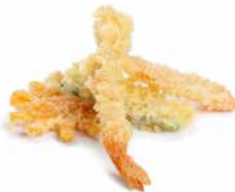
229 TEMPURA MISTO