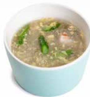
158 ZUPPA ASPARAGI asparagi, surimi*, uova