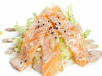
24 SALMON SALAD insalata mix, salmone, salsa di sesamo