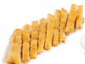
218 COTOLETTA DI POLLO* pollo* fritto...