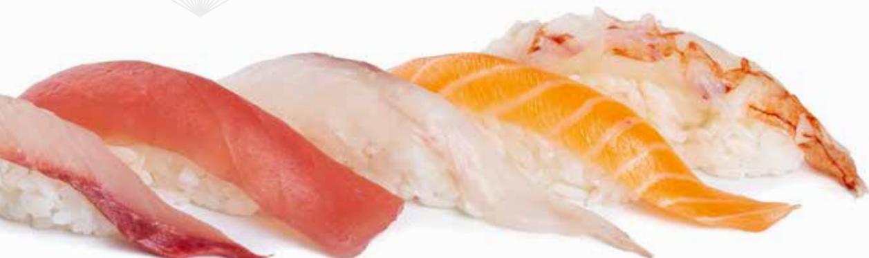
126 NIGIRI MISTO pesce misto