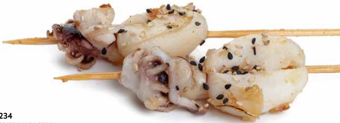
234 SPIEDINI DI SEPPIA* con sesamo