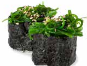
136 GUNKAN NORI WAKAME* 🌿 riso avvolto con alga, con sopra wakame* e sesamo