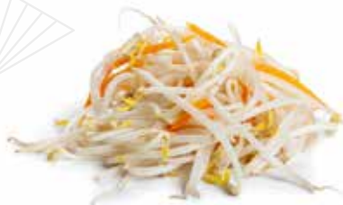
211 GERMOGLI DI SOIA SALTATI 🌱 con carote