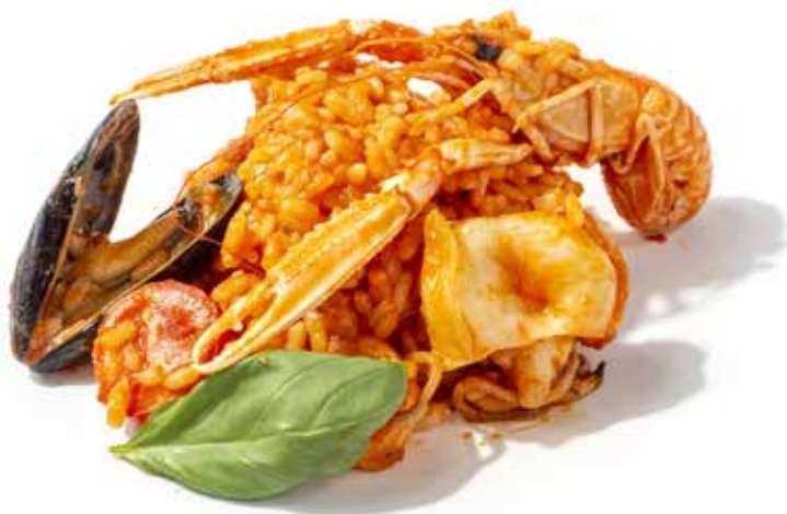
188 RISOTTO ALLO SCOGLIO con frutti di mare