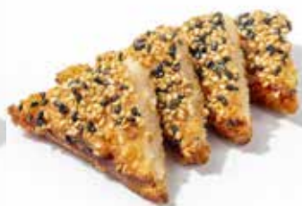
232 TOAST DI GAMBERI FRITTI toast, gamberi, sesamo