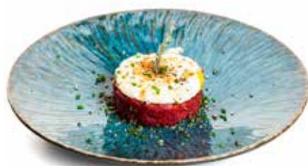
809 TARTARE DI MANZO* con uova mezza soda, pepe nero e cipollotti