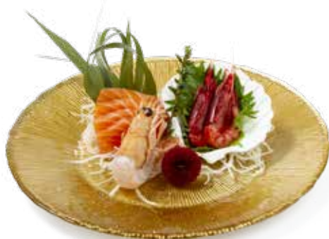
144 BEAUTY SASHIMI salmone, scampi* e amaebi