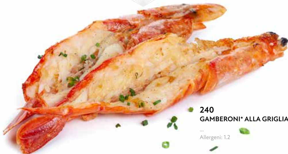
240 GAMBERONI* ALLA GRIGLIA