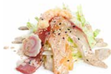
25 MIX FISH SALAD insalata mix, pesce mix, salsa di sesamo