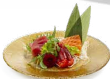
142 RED SASHIMI salmone, tonno, amaebi