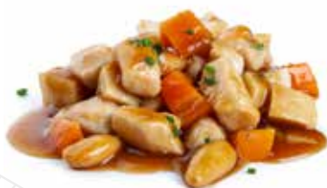
202 POLLO* ALLE MANDORLE pollo*, carote, mandorle, bambù