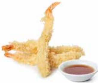
226 TEMPURA GAMBERI*