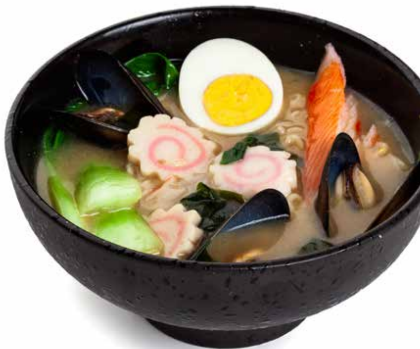
155 RAMEN FRUTTI DI MARE* ramen con verdure, uova e frutti di mare*