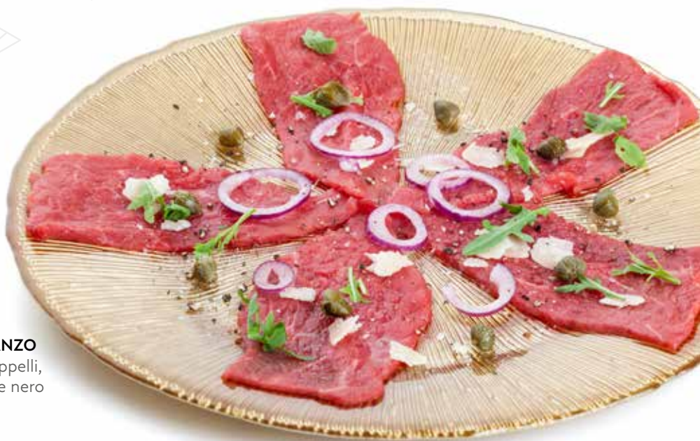
800 CARPACCIO DI MANZO con olio di oliva, cappelli, rucola e grana, pepe nero