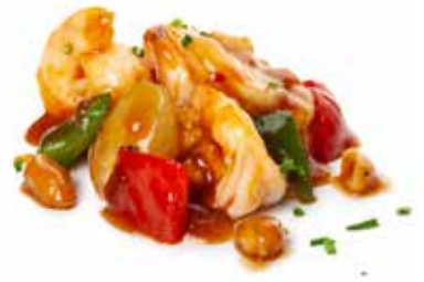
198 GAMBERI* PICCANTI 🌿 gamberi*, peperone, arachidi, cipolla,