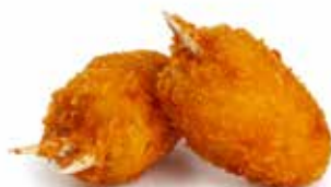
222 CHELE DI GRANCHIO*