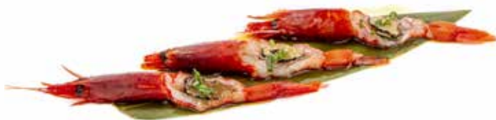
147 CARPACCIO AMAEBI gambero* rosso con fettine di tartufo, cipollotti e salsa paku