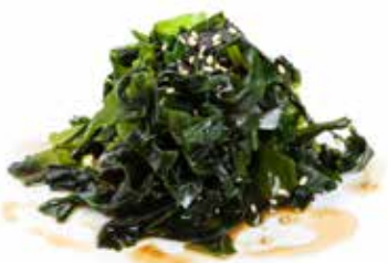
28 GOMAE 🌿 con salsa ponzu e sesamo