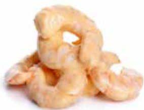
08 COCKTAIL DI GAMBERI* gambero* con salsa cocktail