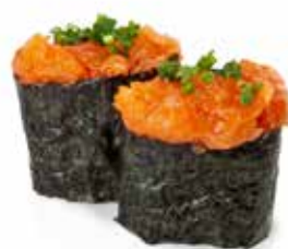
134 GUNKAN NORI SPICY SALMONE 🌿 riso avvolto con alga, con sopra spicy salmone e cipollina