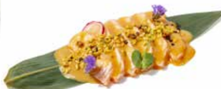
811 SASHIMI SAKE FLAMBÉ salmone scottato, pistacchio, salsa miso