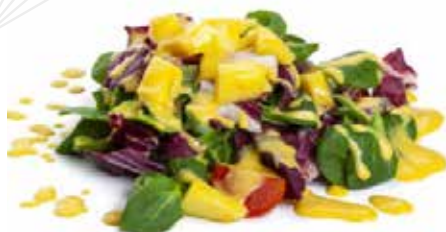
23 SUMMER SALAD insalata mix con mango e salsa mango