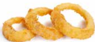
05 CALAMARI* FRITTI