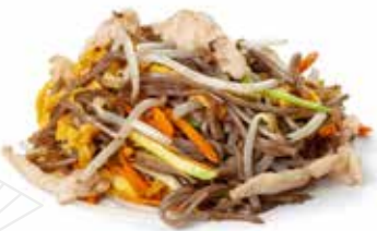
177 SPAGHETTI SOBA CON POLLO* con uova, verdure mix e pollo* ... Allergeni: 1.3.6