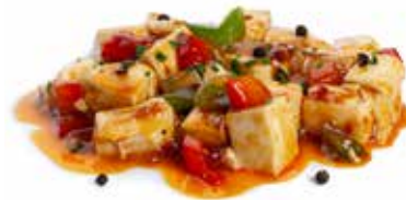
213 SCODELLA DI MAPO TOFU 🌱 tofu, carne, peperone, peperoncini, cipolla,