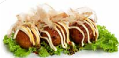
221 TOKAYAKI polpette di polpo*, focchi di pesce, mayonese e salsa teriyaki