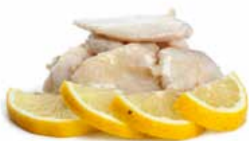
205 POLLO* AL LIMONE