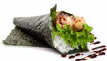
50 TEMAKI SALMON FRY salmone fritto, insalata e teriyaki ... Allergeni: 1.4.6