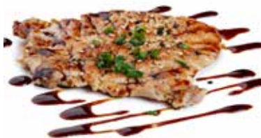
244 CARNE ALLA GRIGLIA con salsa teriyaki e sesamo