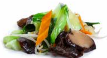
212 VERDURE MISTE SALTATE 🌱 verdura verde con funghi, carote, germogli di soia