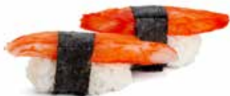
120 NIGIRI SURIMI* surimi* di granchio*