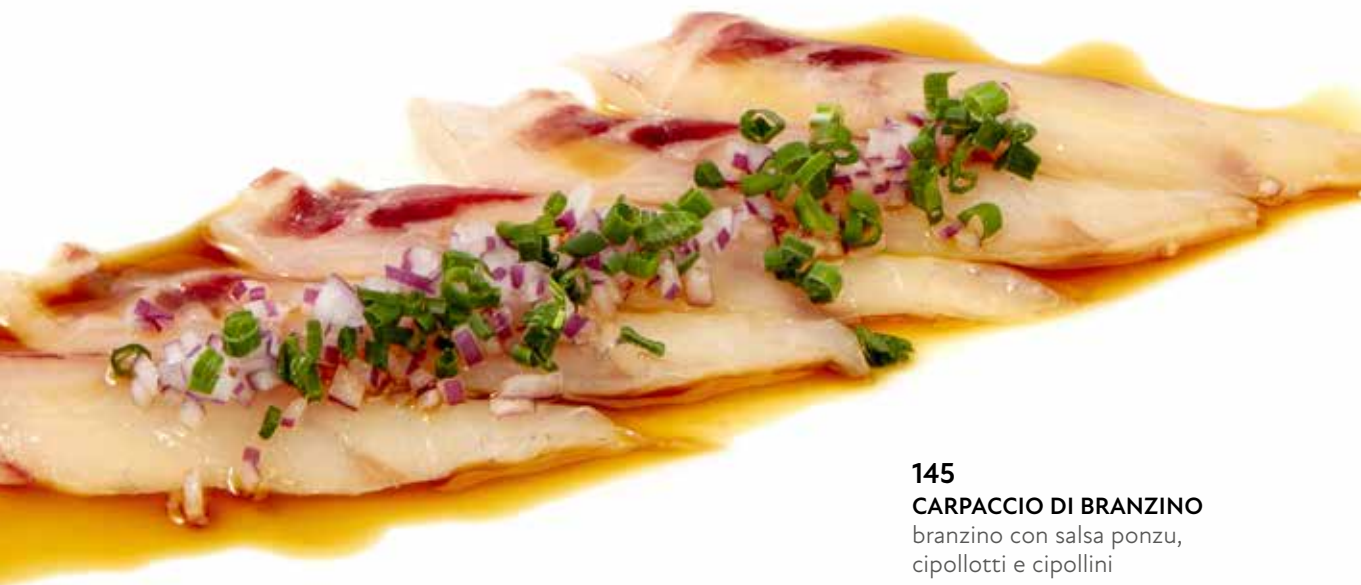
145 CARPACCIO DI BRANZINO branzino con salsa ponzu, cipollotti e cipollini

ORDINABILE 2 PIATTI A PERSONA TRA 145 A 154