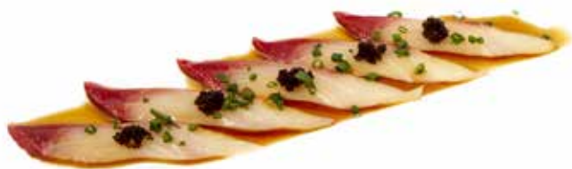
146 CARPACCIO RICCIOLA carpaccio di ricciola con tobiko* nero, cipollotti e salsa paku