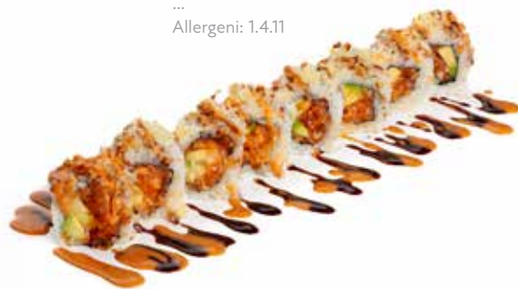
87 URA HOT SPECIAL 🌶️ salmone spicy, avocado, ricoperto con tempura, salsa teriyaki, salsa e sesamo