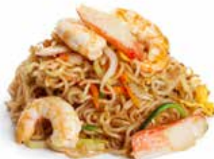
178 RAMEN SALTATO con uova, verdure mix e pesce mix ... Allergeni: 1.2.3.4