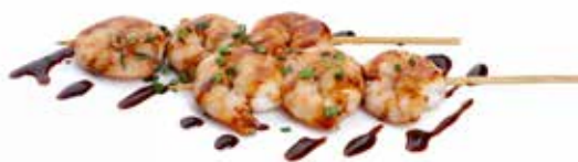
237 SPIEDINI DI GAMBERI* con salsa teriyaki