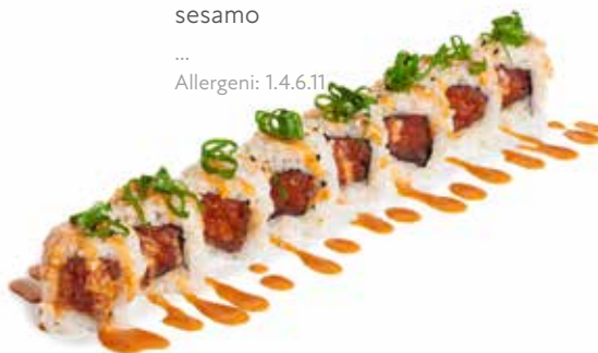
89 URA SPICY TONNO ROLL 🌶️ tartare di tonno spicy, salsa spicy, cipollotti e sesamo