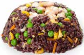
171 RISO VENERE CON GAMBERI* con uova, verdure mix e gamberi* ... Allergeni: 2.3