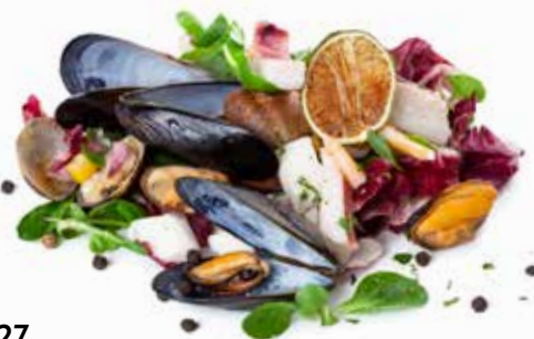
27 SEA SALAD