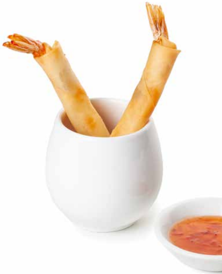
01 EBI STICK involtino di gambero*