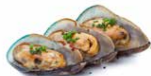
246 COZZE* ALLA GRIGLIA