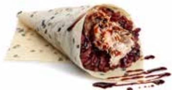
53 TEMAKI BLACK MIURA sfoglia di soia con riso venere, salmone cotto, philadelphia salsa teriyaki e sesamo ... Allergeni: 1.4.6.7.8.11