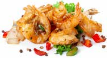
196 GAMBERI* SALE E PEPE