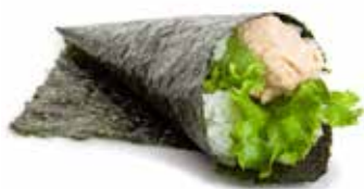
47 TEMAKI CALIFORNIA tonno cotto, avocado, insalata e mayonese