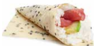
57 TEMAKI SOY TONNO sfoglia di soia con tonno, avocado e sesamo ... Allergeni: 4.6.11