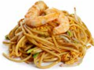
172 SPAGHETTI CON GAMBERI* con uova, mix verdure e gamberi* ... Allergeni: 1.2.3