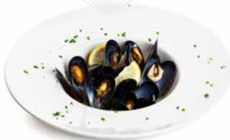
09 COZZE MARINARA cozze, limone e prezzemolo