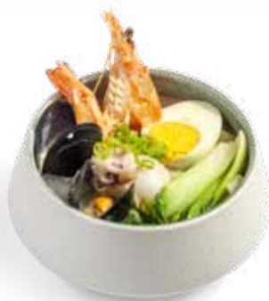
157 SPAGHETTI IN BRODO CON FRUTTI DI MARE* frutti di mare*, uova, verdure e cipollotti