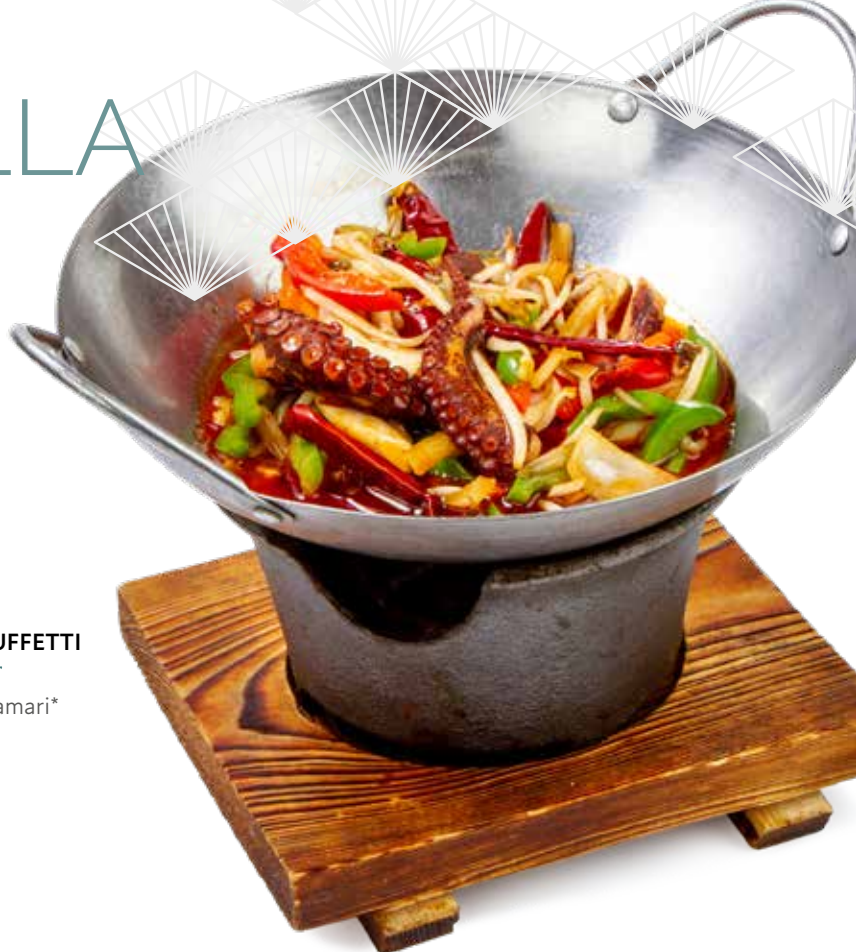
190 SCODELLA AI CIUFFETTI DI CALAMARI* 🌿 verdure mix e calamari*