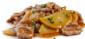
207 MANZO* CON PATATE