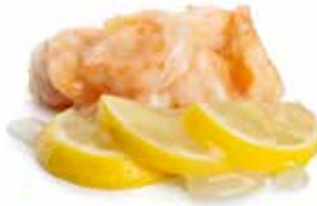
197 GAMBERI* AL LIMONE