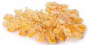
227 TEMPURA PATATE DOLCI 🌿