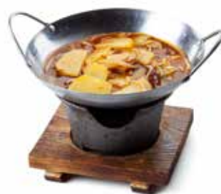
193 SCODELLA DI PATATE 🌿🌿 patate, cipolla