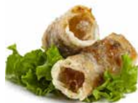
04 VIETNAM ROLL* carne di maiale e verdure miste