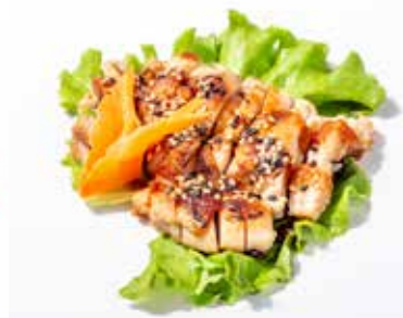
243 POLLO* ALLA GRIGLIA