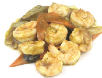
296 GAMBERI* AL CURRY