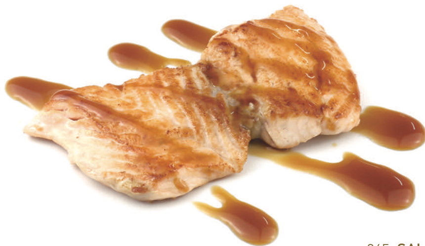
265 SALMONE ALLA GRIGLIA