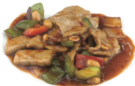
288 MANZO IN SALSA PICCANTE