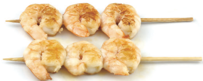
260 SPIEDINI DI GAMBERI* 2pz