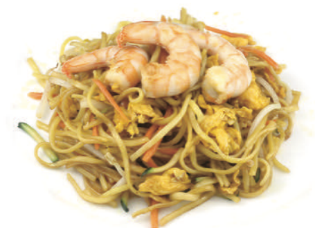
238 SPAGHETTI CINESI SALTATI CON GAMBERI*, VERDURE E UOVA