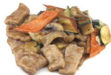
291 MANZO CON VERDURE