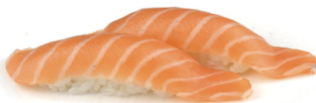
156 NIGIRI SALMONE