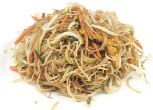
232 SPAGHETTI DI RISO SALTATI CON VERDURE MISTE E UOVA € 5,00 ○