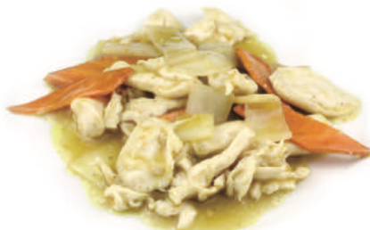
284 POLLO AL CURRY € 6,00