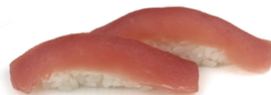
157 NIGIRI TONNO