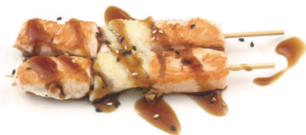
263 SPIEDINI DI PESCE MISTO 2pz