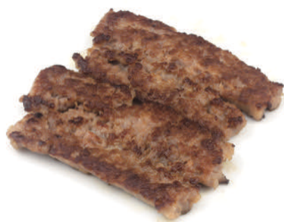
266 SALSICCIA ALLA GRIGLIA