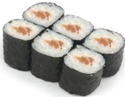
50 HOSO SALMONE € 5,50 (6pz) 🐟