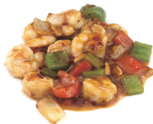
293 GAMBERI* IN SALSA PICCANTE