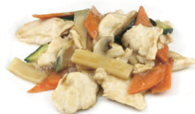
282 POLLO CON VERDURE € 6,50