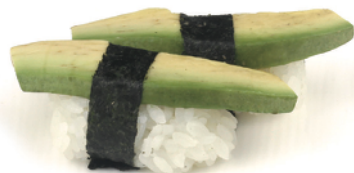
159 NIGIRI AVOCADO