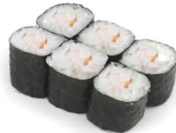
54 HOSO EBI gamberi* cotti € 5,00 (6pz) 🍤