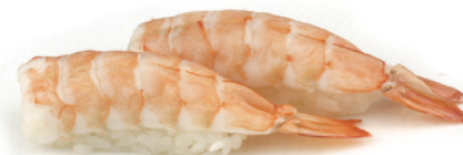
160 NIGIRI EBI