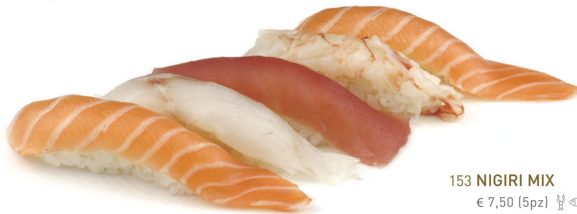
153 NIGIRI MIX