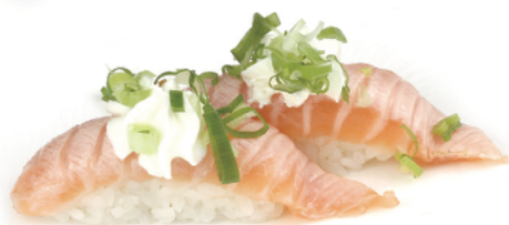
154 NIGIRI SALMONE SCOTTATO