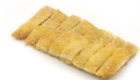
267 COTOLETTA DI POLLO