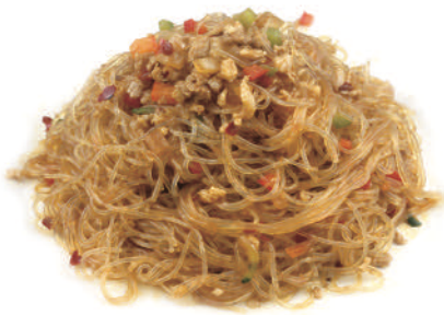
234 SPAGHETTI DI SOIA SALTATI CON MAIALE, PICCANTE E VERDURE € 5,50