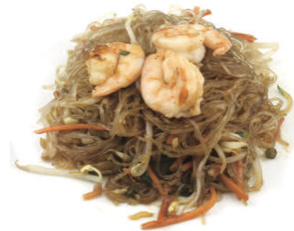
236 SPAGHETTI DI SOIA SALTATI CON GAMBERI* E VERDURE € 5,50 🍴 ○