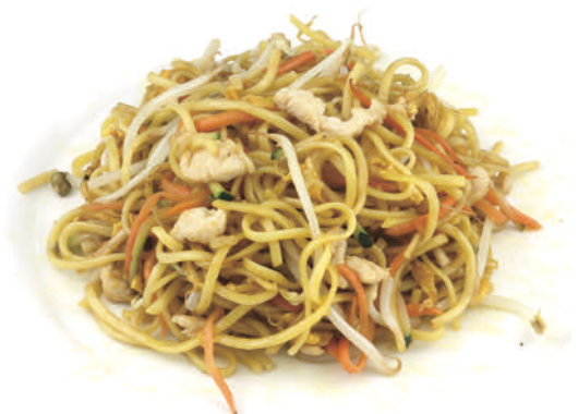
237 SPAGHETTI CINESI SALTATI CON POLLO, VERDURE E UOVA