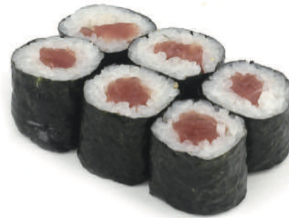
51 HOSO TONNO € 5,50 (6pz) 🐟