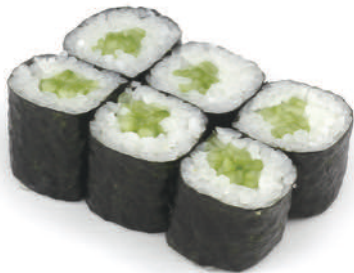
52 HOSO CETRIOLO € 4,50 (6pz)