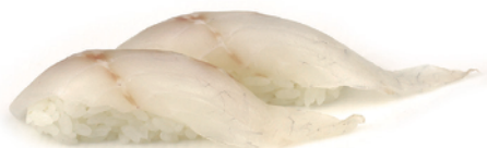
158 NIGIRI BRANZINO