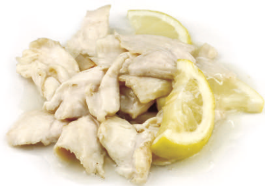
286 POLLO AL LIMONE