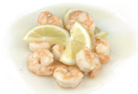
294 GAMBERI* AL LIMONE