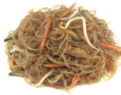
235 SPAGHETTI DI SOIA SALTATI CON VERDURE MISTE € 5,00