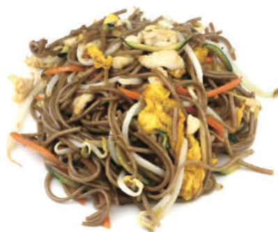
242 YAKI SOBA

spaghetti saltati con pollo, verdure miste, uova