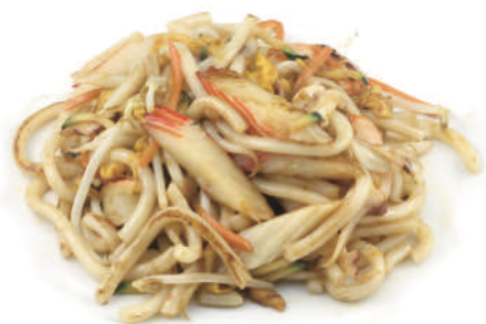
241 YAKI UDON

spaghetti saltati con surimi, gamberi, verdure, uova