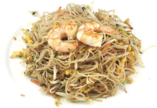
233 SPAGHETTI DI RISO SALTATI CON GAMBERI* VERDURE E UOVA € 5,50 🍴 ○