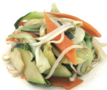
281 VERDURE MISTE SALTATE € 4,50