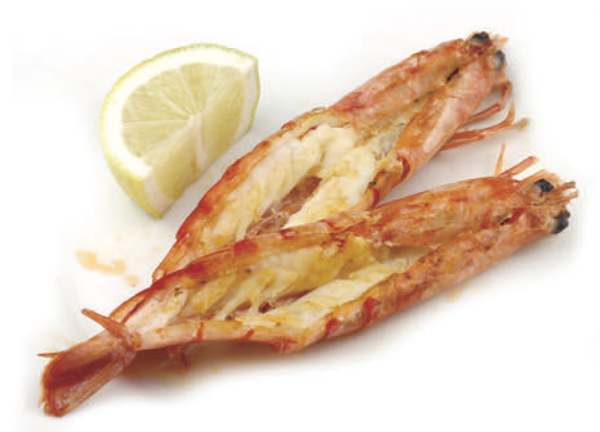
606 GAMBERONI* ALLA GRIGLIA 2pz