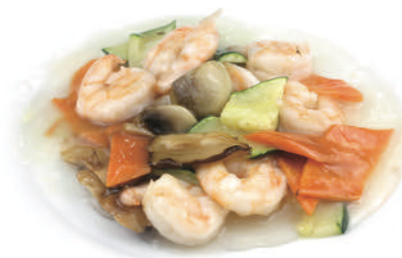
295 GAMBERI* CON VERDURE MISTE