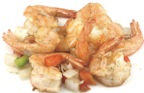
292 GAMBERI* CON SALE E PEPE