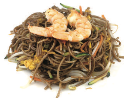
243 YAKI SOBA EBI

spaghetti saltati con gamberi* verdure miste, uova