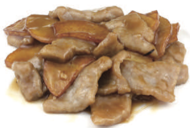
289 MANZO CON PATATE