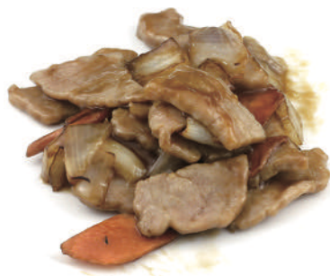
290 MANZO CON CIPOLLA