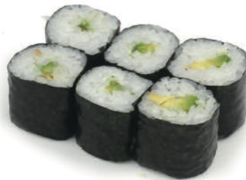
53 HOSO AVOCADO € 4,50 (6pz)